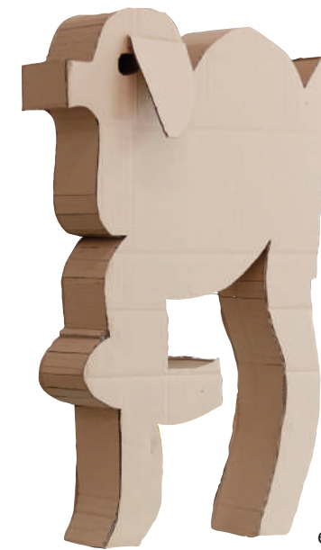
Max Hechinger, Das Schaf , 2026, Foto: Gustav Franz

Die aktuelle Ausstellung in Schloss Britz zeigt in reicher Vielfalt Tierbilder – fabelhaft-poetische wie akribisch-analytische – aus vier Jahrhunderten. Sie fragt, wie Menschen Tiere dargestellt und gedeutet, verstanden oder missverstanden haben. Die Palette reicht