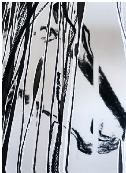
Petra Lottje, Teil der Wahrheit I (Detail), 2026

Als „Krone der Schöpfung“ sah der Mensch sich von alters her als selbstverständlicher Beherrscher der Welt und aller Kreaturen. Waren Tiere zunächst