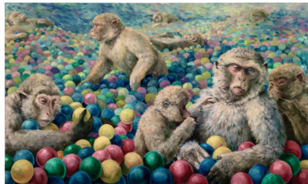
Sebastian Meschenmoser, Lagune , 2022, Foto: Eric Tschernow © VG Bild-Kunst, Bonn 2026

Erst Darwins bahnbrechende Erkenntnisse ordneten den Menschen ein in das evolutionäre Kontinuum der sich wandelnden Arten und stellten die Frage nach dem Selbstverständnis des Menschen ganz neu. Fortwährend relativiert seither die Wissenschaft die einstige menschliche Sonderstellung; die Entdeckung immer weiterer genetischer Gemeinsamkeiten mit Schimpanse, Kugelfisch und Fadenwurm macht den Menschen zu einem Tier unter vielen. Das zunehmende Engagement für