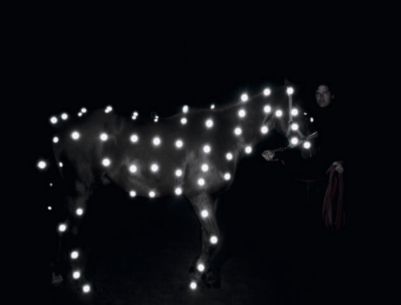
Christof Zwiener, Willano (production image), 2003, Foto: Christof Zwiener © VG Bild-Kunst, Bonn 2026

Die menschlichen Sichtweisen auf Tiere sind vielfältig, oft gegensätzlich und stetem Wandel unterworfen. Wir jagen, schlachten und essen Tiere; wir hüten, streicheln und lieben sie; wir verdrängen und wir schützen sie, wir fangen sie ein und wir wildern sie aus. Sie können uns ekel und schocken (Spinnen, Haie und Wölfe) oder wir finden sie lustig und süß (Affen, Welpen und Kätzchen); sie sind uns unterworfen, dienstbar und nützlich oder sie werden uns zu treuen Freunden und lebenslangen Partnern.