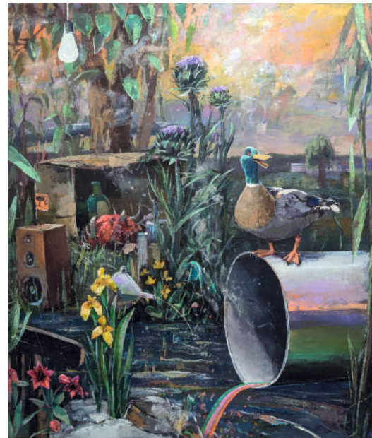
Fritz Bornstück, Private Property , 2025, Foto: Stefan Hähnel